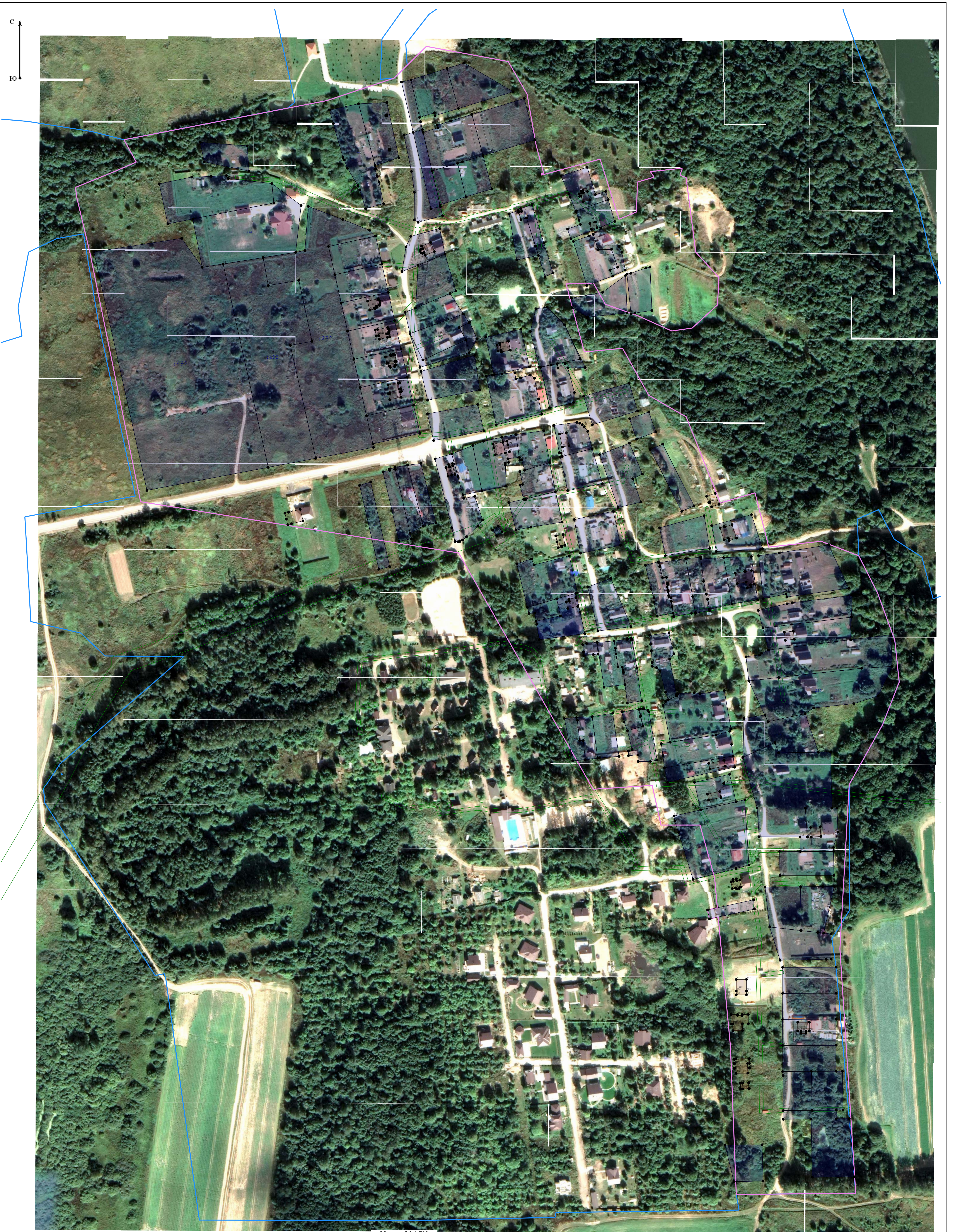
Масштаб 1:1 700