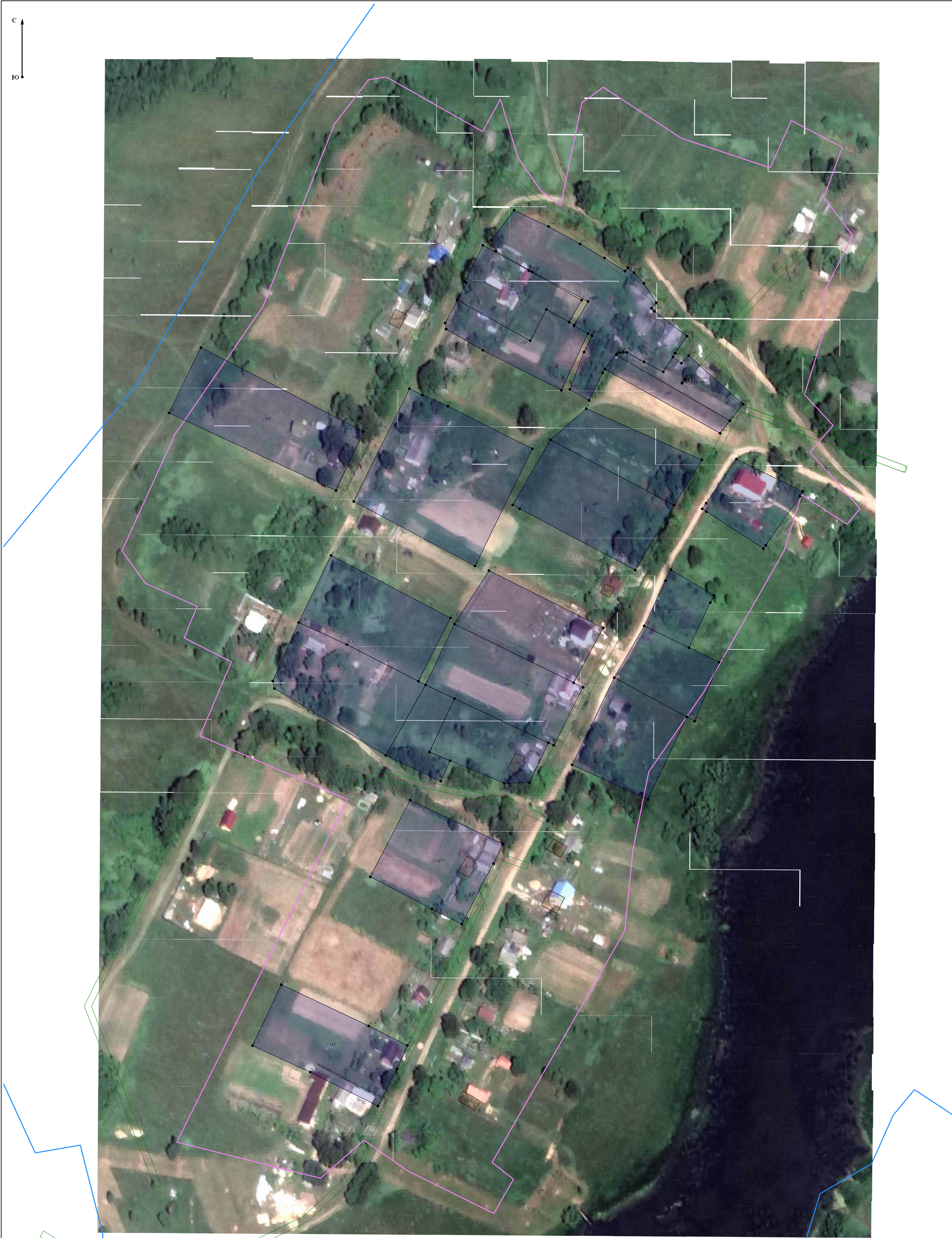
Масштаб 1:1 000