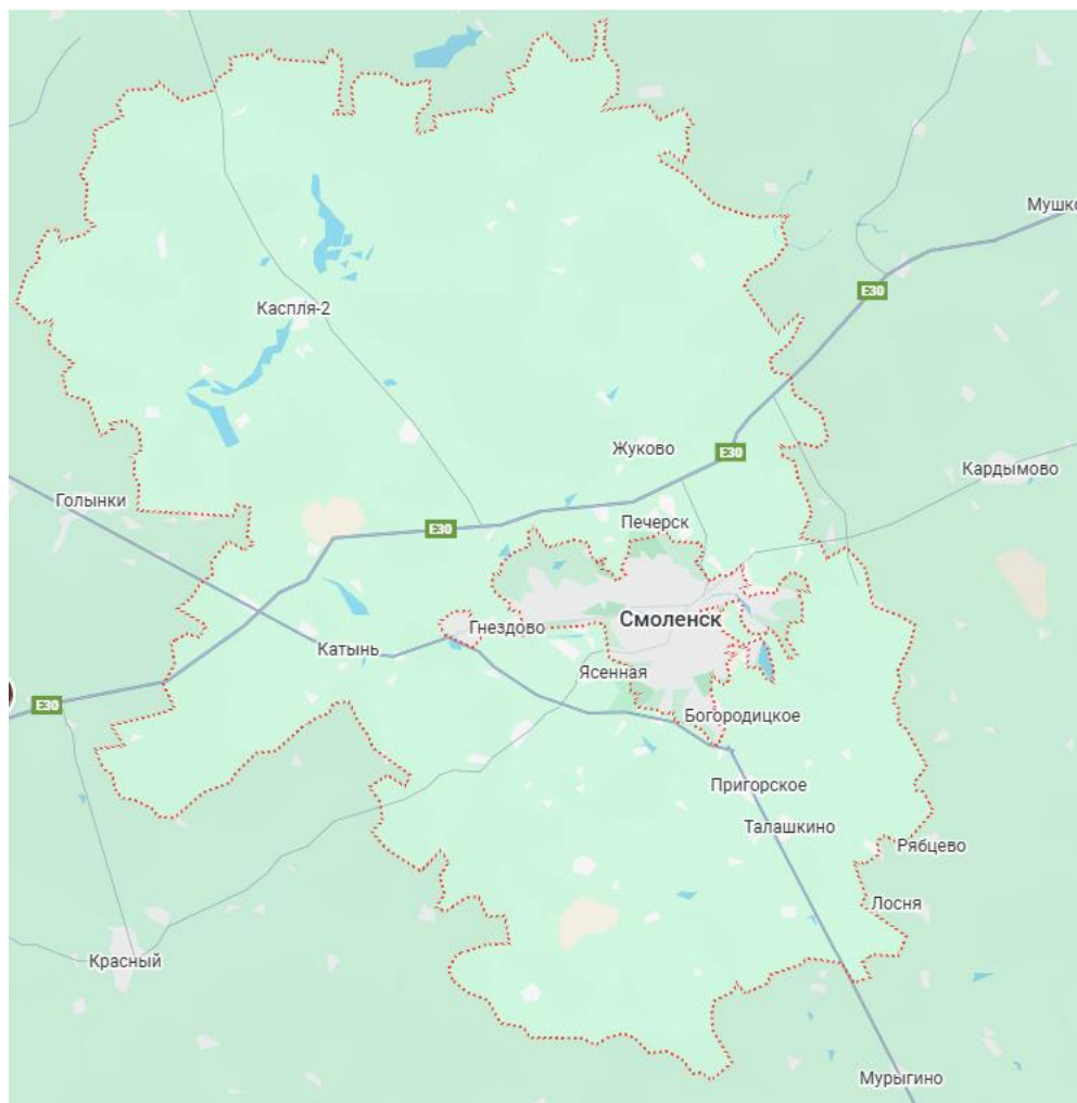
Рисунок 1 – Смоленский муниципальный округ Смоленской области

Административным центром Смоленского муниципального округа является г. Смоленск.