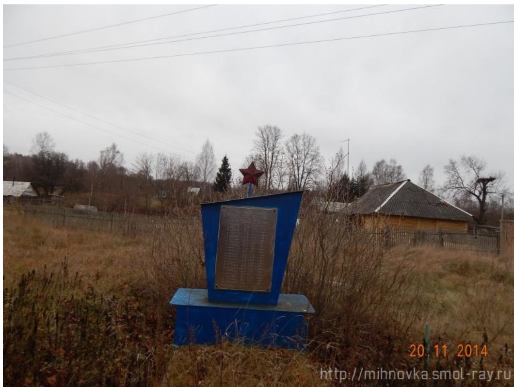
д.Катынь-Покровская, Памятный знак