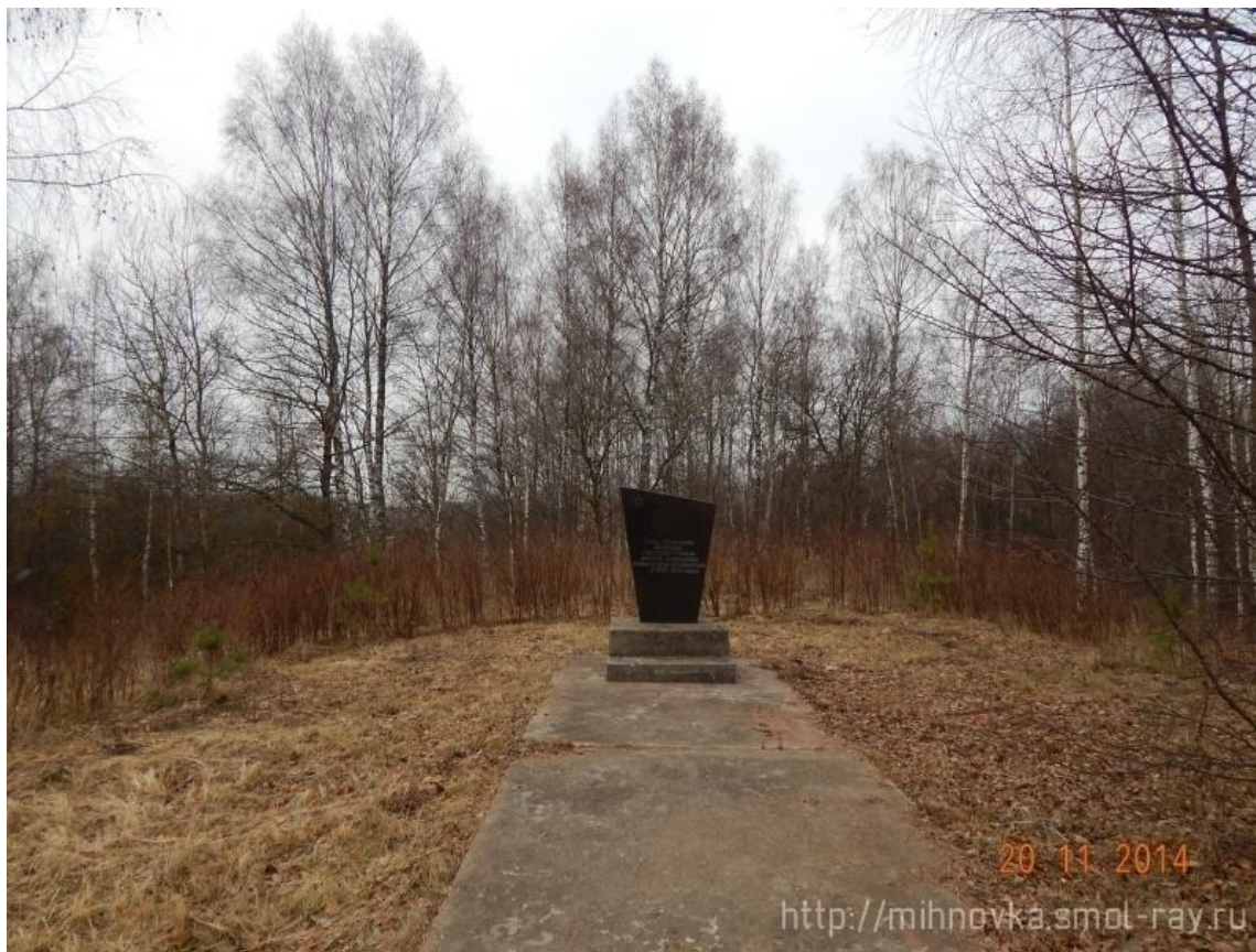
д. Ясенная, захоронение более 1000 советских граждан