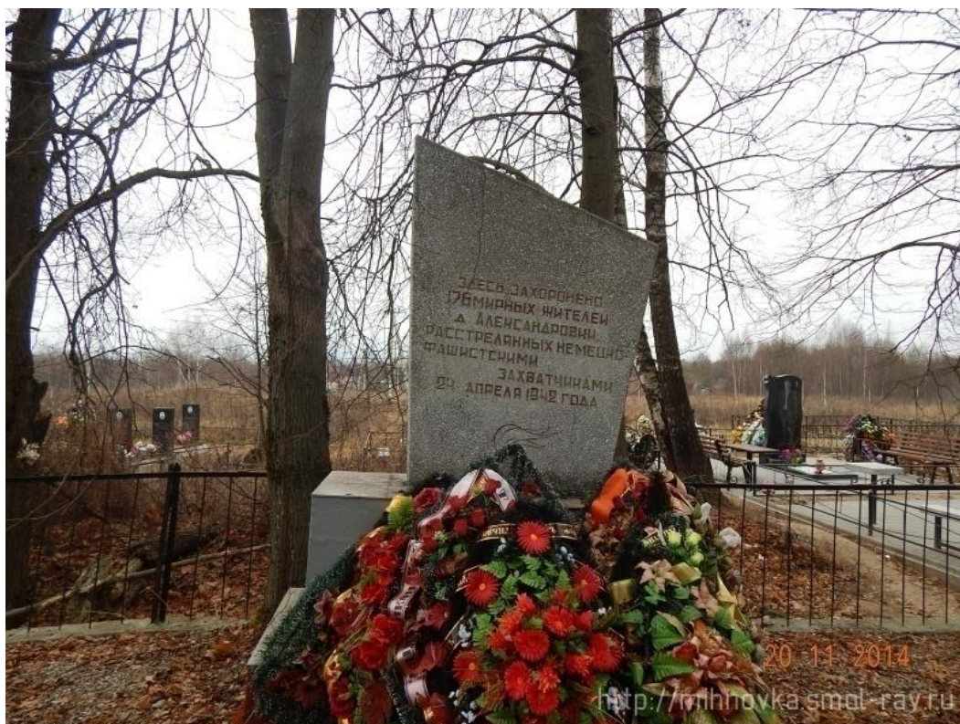
д.Александровка, Братская могила

Над захоронением шефствует Администрация Михновского сельского поселения.