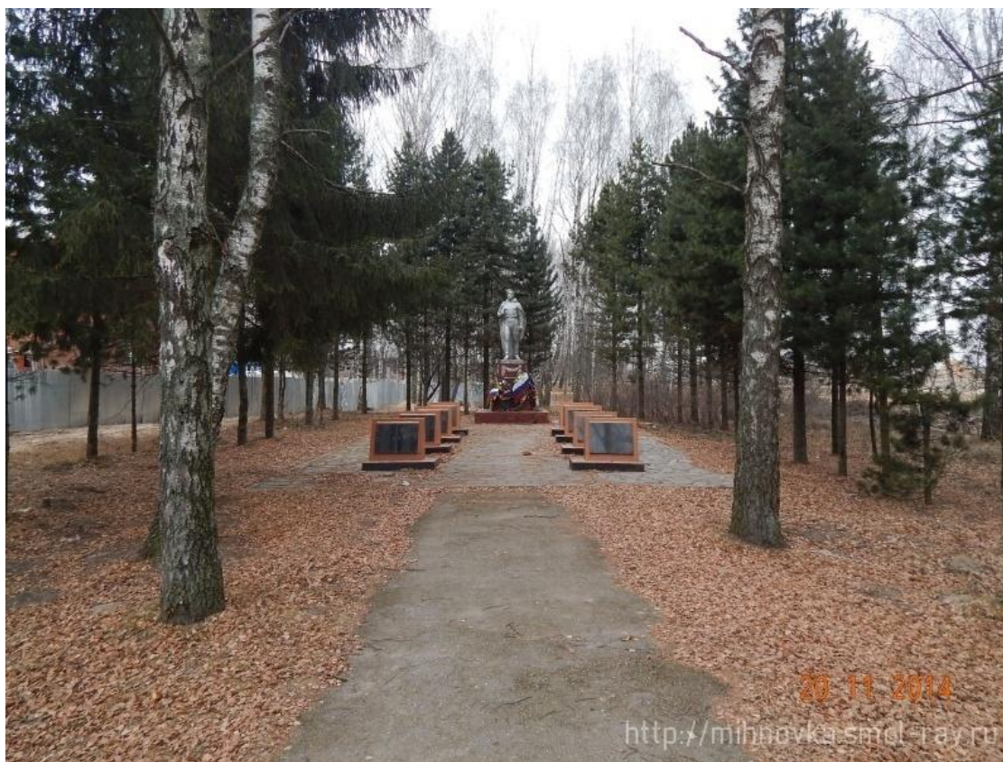
д.Михновка, Памятный знак