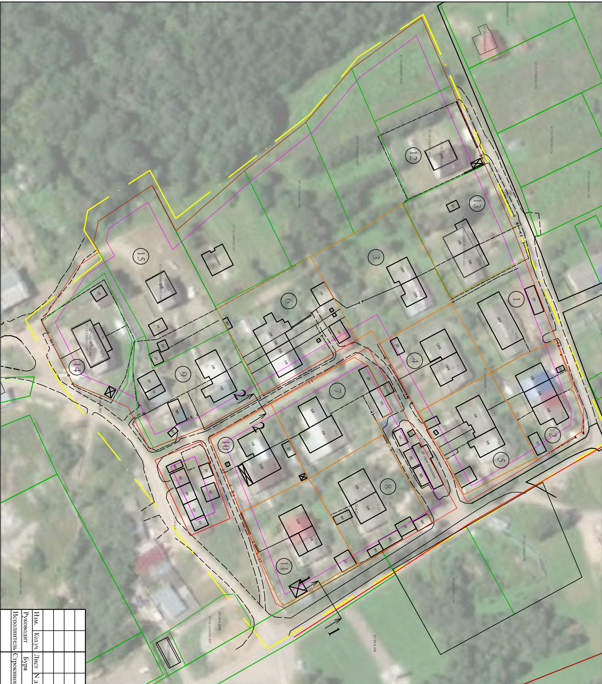
Схема организации движения транспорта и пешеходов, отражающая местоположение объектов транспортной инфраструктуры и учитывающую существующие и прогнозные потребности в транспортном обеспечении на территории, а также схема организации улично-дорожной сети

Документация по планировке территории в границах кадастрового квартала 67:18:2360101 расположенного по адресу: Смоленская область, Смоленский район, Корохоткинское с.п.п. Плембаза, д.21А, д.21, д.20, д.19, д.18, д.17, д.16, д.15, д.14, д.13, д.12, д.11, д.10, д.27А, д.12А