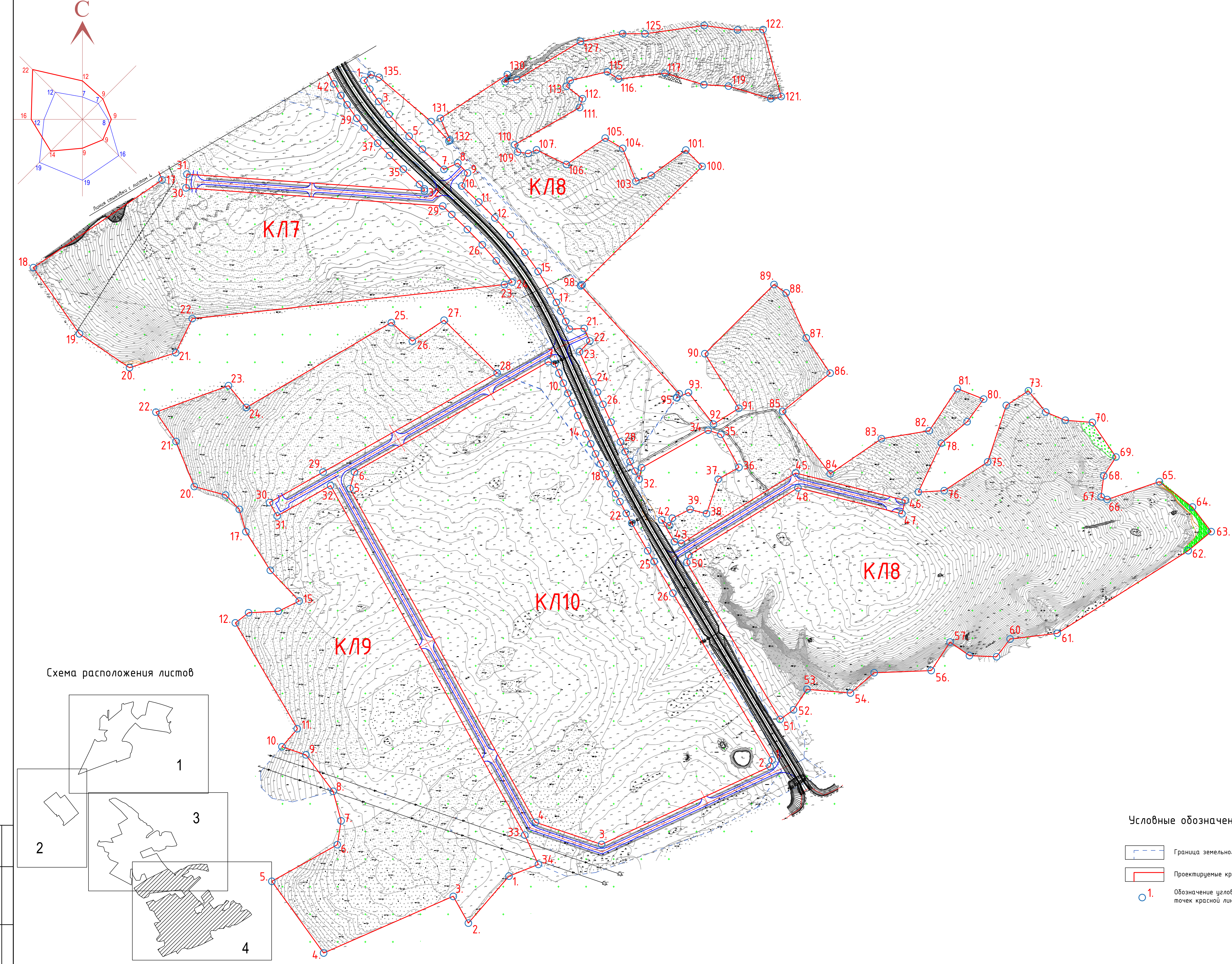
Схема расположения листов